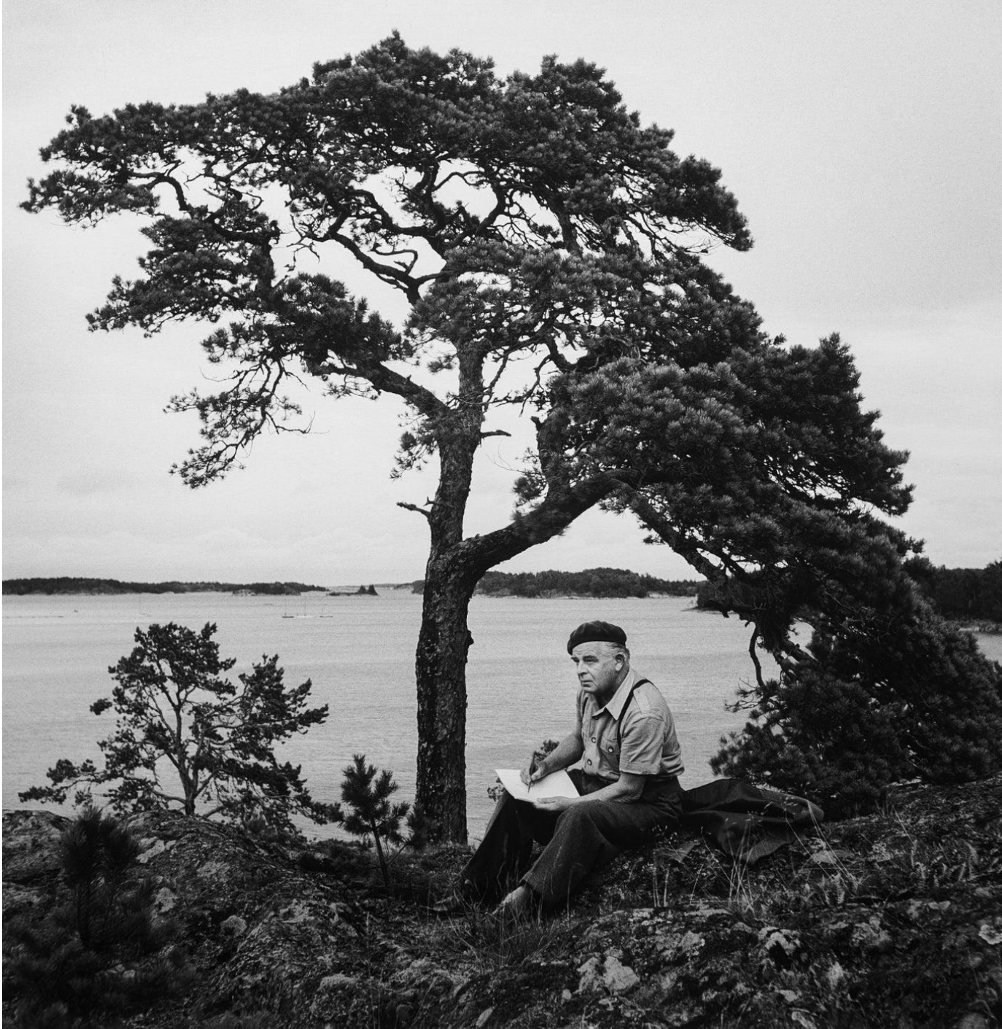
Evert Taube på Sjösala 1953