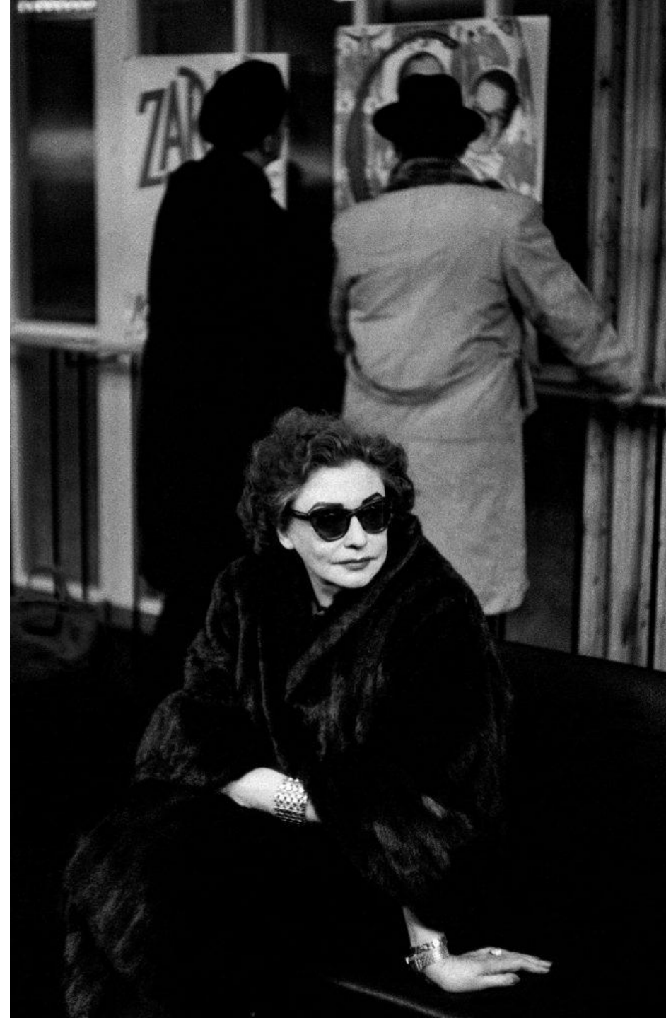
Zara Leander 1957