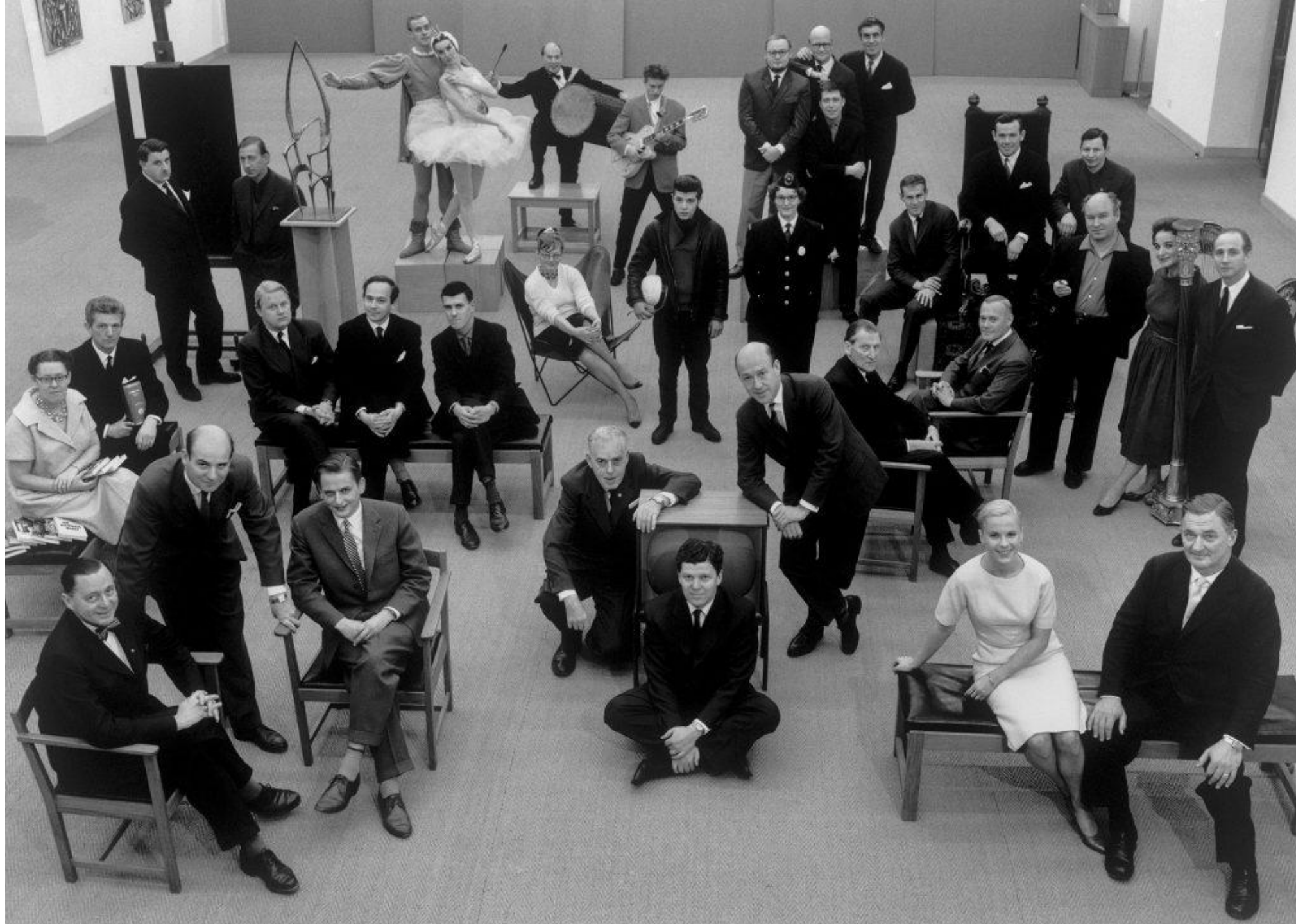
Moderna Muséet 1959